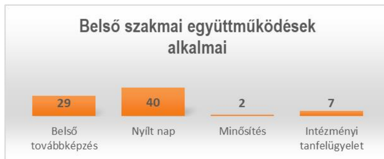
7. sz. diagram