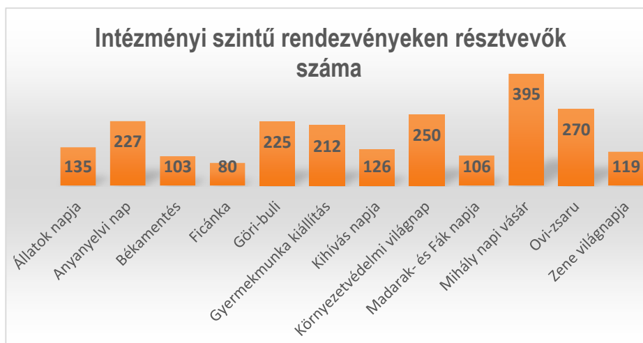
4. sz. diagram