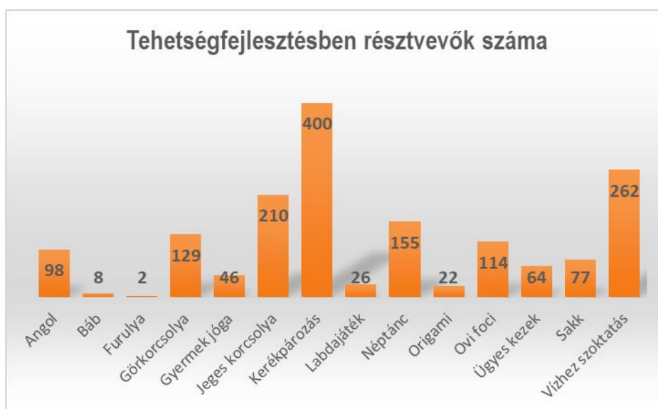
6. sz. diagram