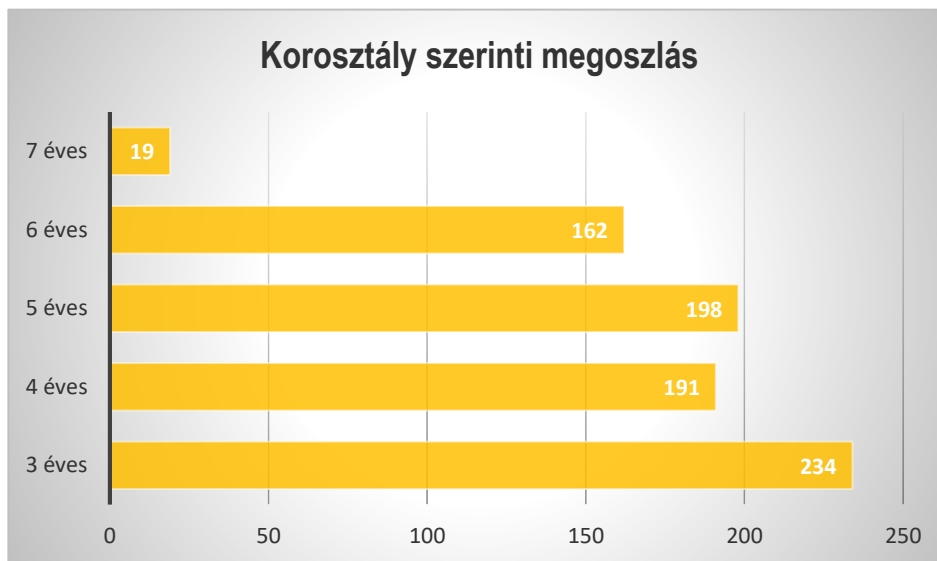
1. sz. diagram