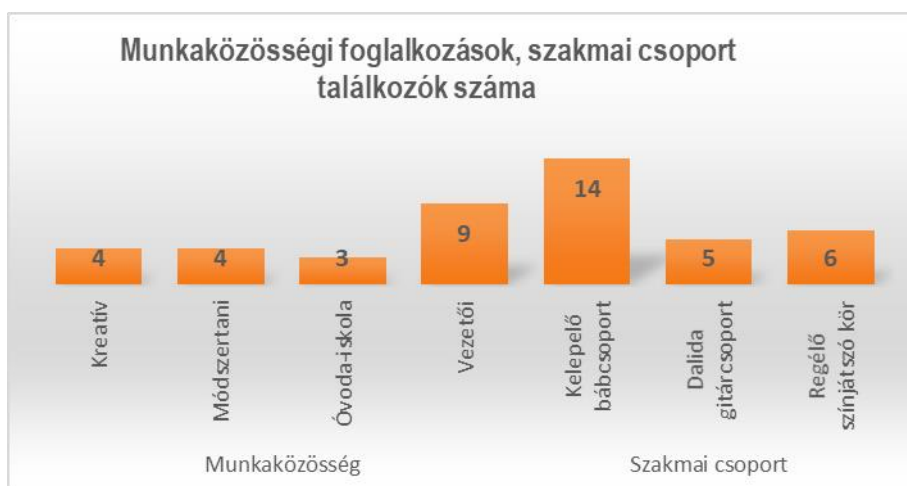
3. sz. diagram