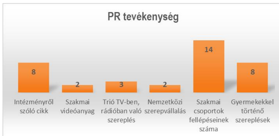
9. sz. diagram