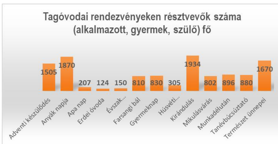
5. sz. diagram